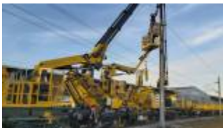
Geismar virevolte sur le 1500 V