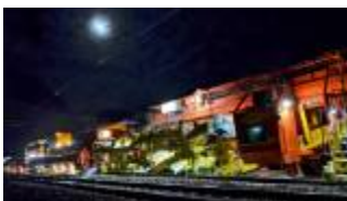
Pas de trêve estivale pour le P95T